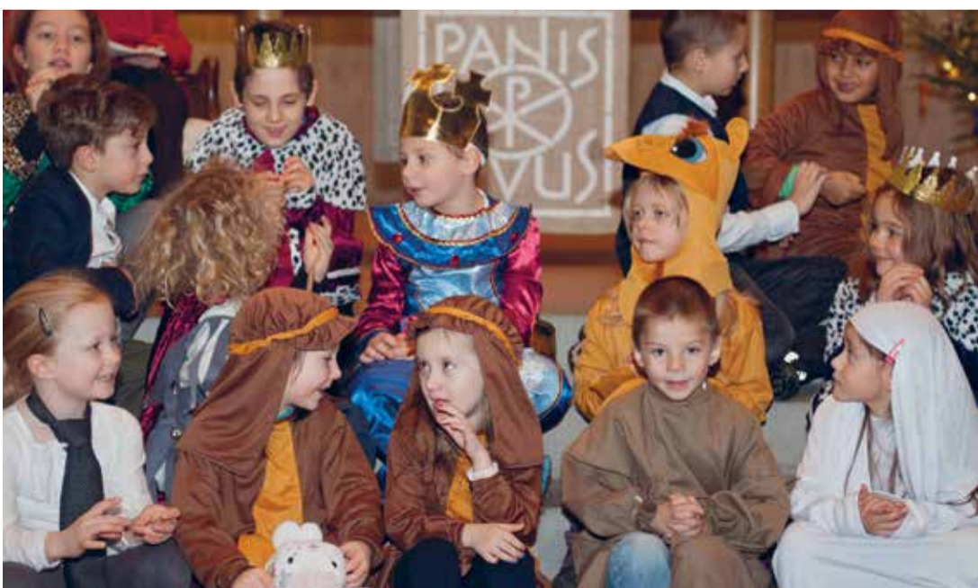
Impressionen von Leimbach vom letzten Jahr

Wiehnachtsfir: Freitag, 14. Dezember, 19.00 Uhr, Johanneum Gertrudstrasse 59, 8003 Zürich