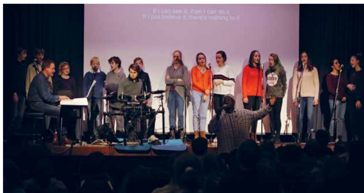
Impression von der letztjährigen Wiehnachtsfir