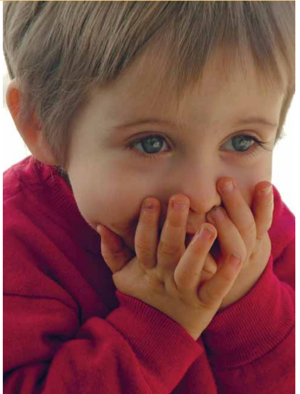
Zeit zum Staunen und Geniessen