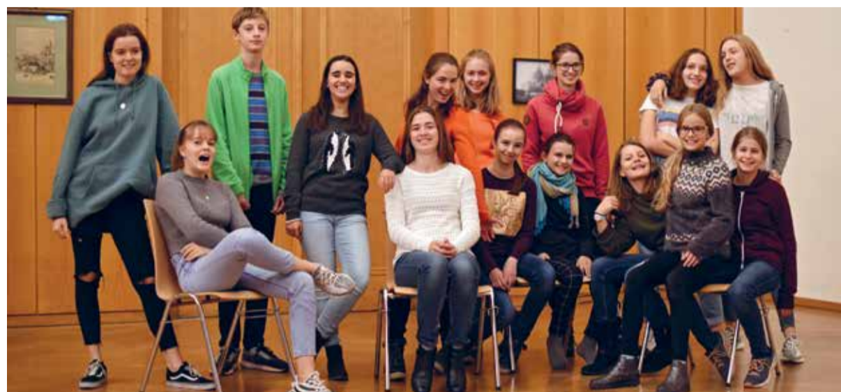
Jugendchor Enge beim Vorbereiten des Greencity Advent...

Green City Advent: Samstag, 8. Dezember, 17.00 Uhr, Gewerberaum 151 (gerade neben der SZU Haltestelle Manegg)