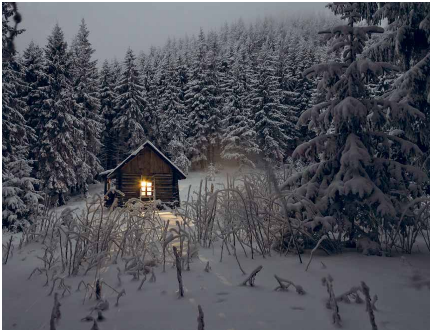
Wenn es Licht wird